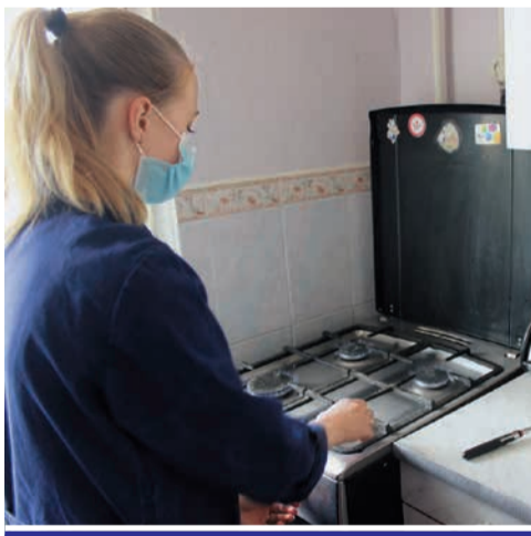
Вооружена (инструментами) и прекрасна!