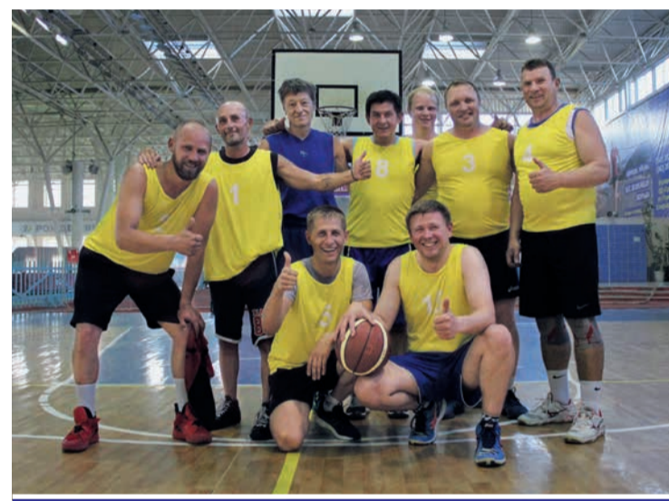
Команда Центрального аварийно-диспетчерского управления – супер-профессионалы своего дела и боги на спортивной площадке

В эстафете соревновались команды мужчин Производственного управления – 2, 3 и Центрального аварийно-диспетчерского управления (ЦАДУ). Несмотря на неудачный старт, преимущество в эстафете захватили сотрудники аварийного управления. Им и достались «золото» и кубок победителей. Второе место – у команды Производственного управления-2, ПУ-3 стали «бронзовыми» призерами.