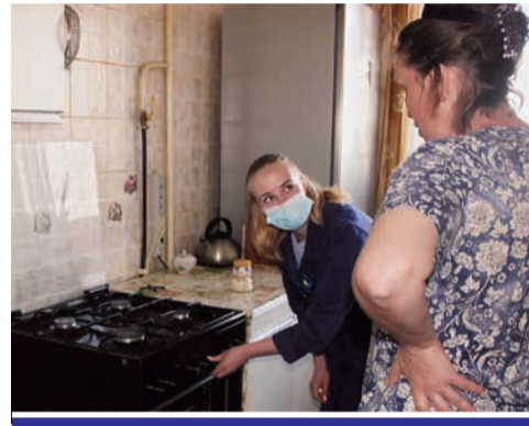
«Мы – не менеджеры продаж, мы – сотрудники «Екатеринбурггаза», и работаем на совесть, чтобы у людей в доме было безопасно».

Тут хозяйка вспоминает, что почти у всех соседей в подъезде бывали лжегазовики, да и сама она однажды стала жертвой мошенников. «Как-то пришли к нам какие-то мастера и говорят, шланг у вас старый, давайте вам сейчас поменяем». Я согласилась, они в итоге что-то покрутили, взяли с меня две тысячи рублей и ушли. Муж вечером приходит и выясняется, что шланг этот вообще не должен использоваться в газовой системе и вдобавок ужасно воняет. Муж сразу повторно вызвал специалистов, уже проверенных, «екатеринбурггазовских», – рассказала женщина.