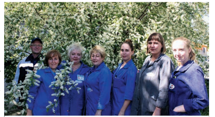
Дружная бригада службы домовых сетей АО «Екатеринбурггаз»

«Иногда мне кажется, что нас готовят, как к полёту в космос. Каждый год проходит столько обучающих курсов. Я люблю узнавать новую информацию и получать полезные инструменты для работы. После последнего обучения по клиентоориентированности мне стало проще находить общий язык не только с абонентами, но и с коллегами, друзьями. Техники коммуникации, которые мы разбирали на курсах, универсальны для многих жизненных ситуаций. Хотелось бы и дальше учиться новым и полезным навыкам. Здорово, что «Екатеринбурггаз» дает сотрудникам возможность для саморазвития».