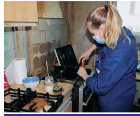
Старые плиты – угроза самим жильцам и их соседям!

давно надо менять. Внимательно за ней смотрите, мойте чаще, чтобы сильного загрязнения не было, так как под слоем жира может газ скапливаться, и там до беды недалеко. Решетки с вентиляционных каналов тоже, пожалуйста, не забывайте чистить. Когда они засоряются, тяга становится хуже. И как можно скорее меняйте газовое оборудование. В первую очередь думаем о своей безопасности и соседей, хорошо? Зачем вам лишние переживания?»